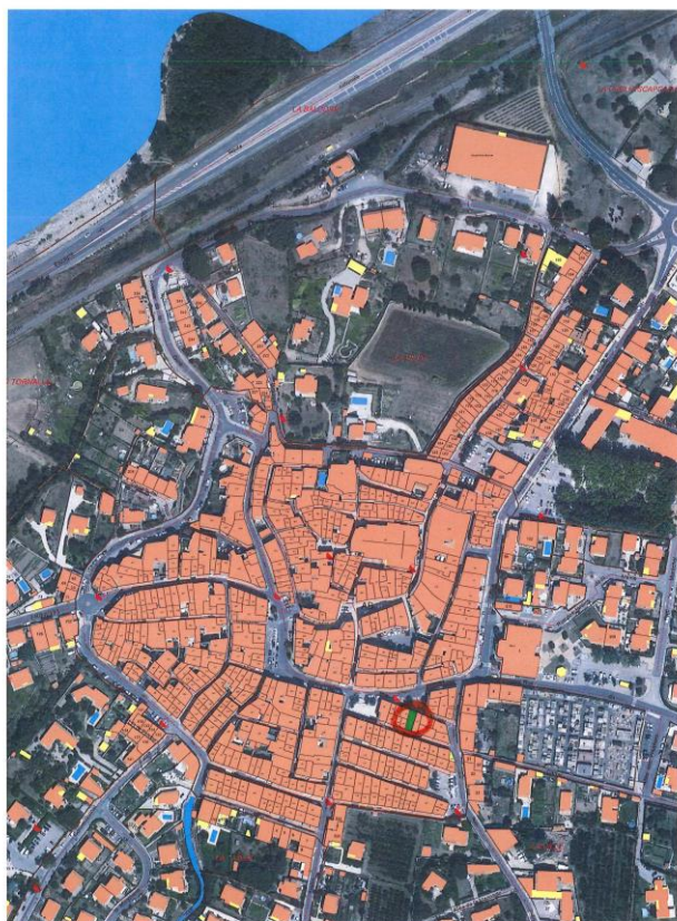
Plan de situation du Café de France Echelle: 1/2500.